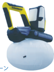
バックホーバルーン

カタログ記載以外のバルーン作成も承ります。企業キャラクターや自治体、各地域のマスコットの他、大型バルーンなどお客様のアイデア次第で幅広い使い方ができます。詳しくはご相談ください。