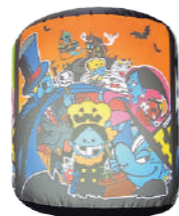
ハロウィンイベント